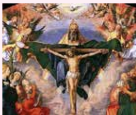
"Vi manderò lo Spirito che procede dal Padre".

21.00: Processione e incoronazione della Vergine.